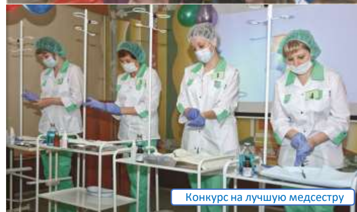
Конкурс на лучшую медсестру